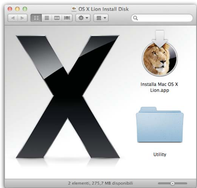
Figura 3: Lion Disk Maker ha creato la chiavetta di avvio.

Quando dovrete reinstallare OS X Lion, inserire la chiavetta nel Mac, e avviatelo tenendo premuto il tasto Alt . Quando appare l'elenco dei dischi di avvio disponibili selezionate la chiavetta e procedete all'installazione.