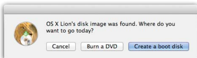
Figura 1: Lion DiskMaker chiede se masterizzare un DVD o preparare un disco di avvio usando altri tipi di memoria di massa.

Con l'immagine disco così ottenuta, potete ora creare una chiavetta adatta all'avvio di un Macbook Air o di un Mac Mini non dotati di unità DVD. Per fare questo ricorreremo all'applicazione Lion DiskMaker, che potete scaricare all'indirizzo: http://blog.gete.net/lion-diskmaker/ , e una chiavetta USB da 4 GB. Aprite Lion DiskMaker, la prima finestra che vi verrà mostrata, visibile in figura 1 vi chiede se volete masterizzare un DVD oppure creare un disco di avvio usando un 'altro tipo di memoria di massa, come una chiavetta USB.