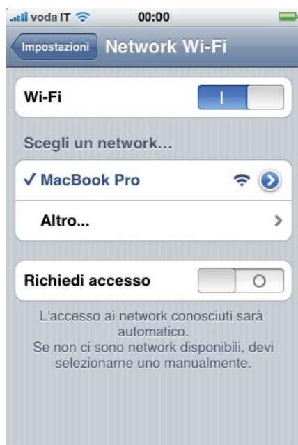
Figura 3: impostazione della rete wireless su iPhone

Una volta creata la rete wireless usando l'antenna del Mac, dovrete collegarvi l'iPhone. Per fare questo, sull'iPhone, toccate l'icona Impostazioni, nella schermata successiva premete su Wi-Fi , se il Network Wi-Fi è disattivo, attivatelo spostando verso destra l'interruttore Wi-Fi , come mostrato in figura 3 . Immediatamente l'iPhone farà una scansione della rete e troverà il vostro computer, per attivare la connessione toccatela semplicemente.