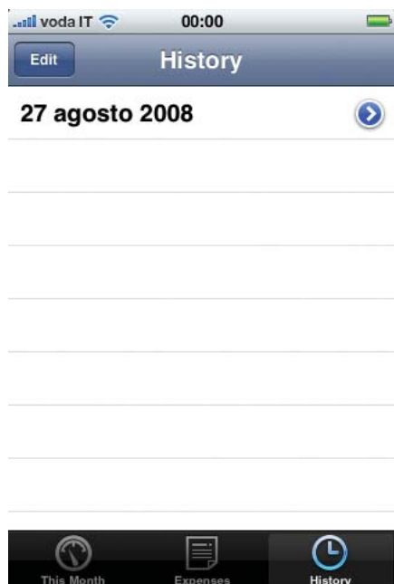
Figura 6: la schermata History mostra le spese dei mesi precedenti

Fino ad ora abbiamo visto come avere dei resoconti del giorno e del mese in corso, comprese le categorie in cui si è speso di più, con l'andare dei mesi potreste voler sapere quello che avete speso nei mesi precedenti, per fare questo, nella parte bassa della schermata toccate l'opzione History , che vi mostrerà le spese dei mesi precedenti. In figura 6 , potete vedere le spese di agosto, toccandola accederete alla schermata Expanses , già vista nella figura 4 , con le spese del mese che avete toccato.