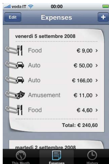
Figura 4: la schermata Expanses dove sono riepilogate le spese in dettaglio

Come dicevamo il riquadro Expanses , presente nella schermata This Month , vi mostra un riepilogo di quello che state spendendo nel corso del mese, ma se volete vedere esattamente le singole voci di spesa, potete farlo toccando, nella parte bassa dello schermo, l'opzione Expanses che vi porterà all'omonima schermata visibile nella figura 4 , dove una sorta di scontrino vi mostrerà le singole spese divise per giorno, con la somma della spesa per ogni giorno del mese in corso.