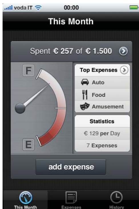
Figura 1: la schermata principale di Pennies offre una panoramica sull'andamento mensile

Non appena aprirete il programma, vi apparirà la schermata visibile in figura 1 , si tratta della finestra This Month che offre una panoramica veloce dell'andamento del mese in corso. Nella parte alta, nel riquadro Spent , è presente la spesa attuale e il budget mensile, sulla sinistra un indicatore grafico della spesa, sulla destra due box: Top Expenses e Statistic , il primo indica le categorie in cui si è speso di più, mentre il secondo vi offre una statistica della spesa media giornaliera.