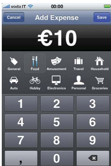
Figura 3: la schermata Add Expense per registrare le proprie spese

Quando effettuate una spesa e volete registrarla su Pennies, non dovete fare altro che toccare il pulsante add expense , che vi mostrerà la schermata visibile in figura 3. Con il tastierino numerico inserite la cifra che avete speso e nella parte centrale dello schermo selezionate la categoria che preferite tra: General (spese generali), Food (Mangare), Amusement (divertimenti), Travel (viaggi), Household (famiglia), Auto (automobile), Hobby , Electronics (Elettronica), Personal (spese personali) e Groceries (Supermercato e spese per la casa), ognuna di queste categorie è contraddistinta da una piccola icona che vi aiuterà visivamente a scegliere quella più corretta. In fine toccate il pulsante Save per registrare la vostra spesa.