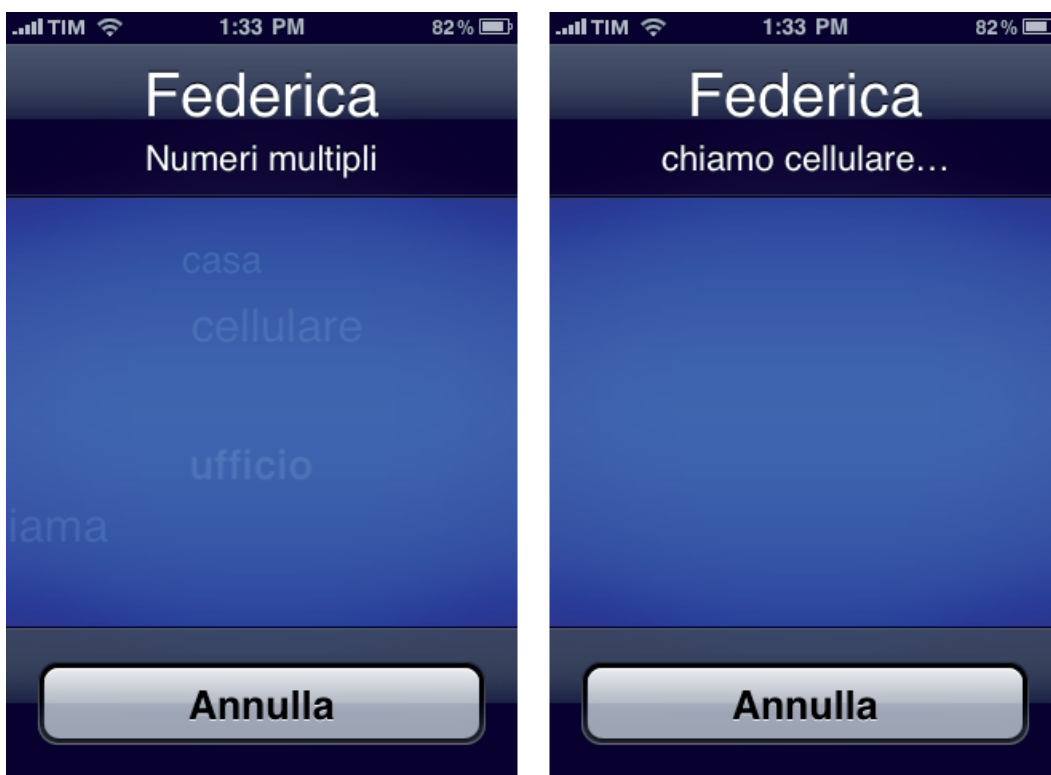
Figura 2: il controllo vocale è in grado di riconoscere riferimenti multipli nella rubrica indirizzi

Per eseguire una chiamata, magari richiamando un nome della rubrica indirizzi, pronunciate “ Chiama ” seguito dal nome di battesimo della persona, oppure scandite semplicemente il nominativo. L’iPhone è molto intelligente ed è in grado di trovare riferimenti multipli come visibile in figura 2 . Per esempio, se avete più di un amico che si chiama Federica, l’iPhone vi domanderà quale volete sentire leggendovi nome e cognome. Se poi il soggetto selezionato ha più di un telefono in rubrica, vi chiederà anche se preferite telefonare a casa, in ufficio o sul cellulare.