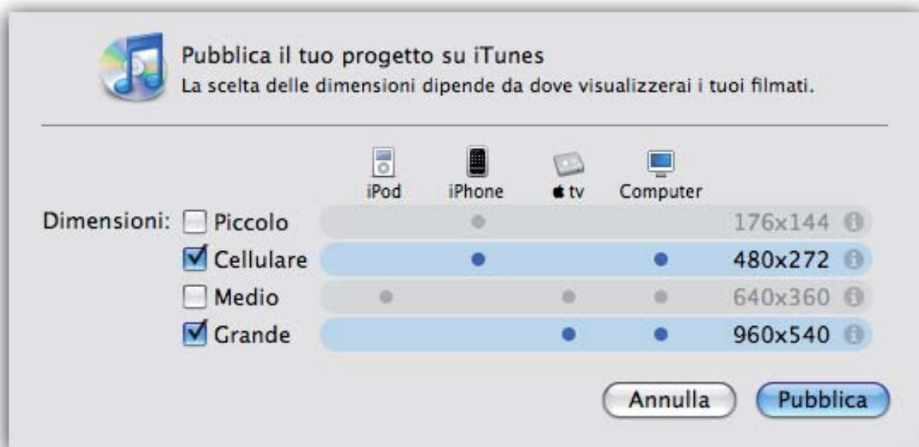
Figura 1: il menu di esportazione per iTunes

Una volta terminata la fase di montaggio, è ora di proporre il vostro capolavoro al resto del mondo. Ci sono tanti modi per farlo e iMovie li prevede praticamente tutti. La condivisione può essere fatta per il Web o, più che altro, per un uso privato attraverso l'esportazione per dispositivi portatili o domestici . Il menu Condivisione , in alto, consente di effettuare tutte queste operazioni con estrema semplicità. Scegliete, per esempio, di esportare il vostro filmato per iTunes. Vi verrà mostrata la finestra di dialogo visibile in figura 1 , dove sono presenti alcune opzioni disposte in una griglia, per meglio comprendere la destinazione d'uso del filmato esportato. Nella griglia, in alto, trovate i dispositivi mobili, come iPod, iPhone, Apple TV e computer in generale. Se nella parte a sinistra selezionate la voce Cellulare , vedrete illuminarsi i pallini sotto iPhone e Computer , mentre resteranno grigi iPod e Apple TV . Questo vi indica i dispositivi in cui sarà possibile visualizzare il filmato.