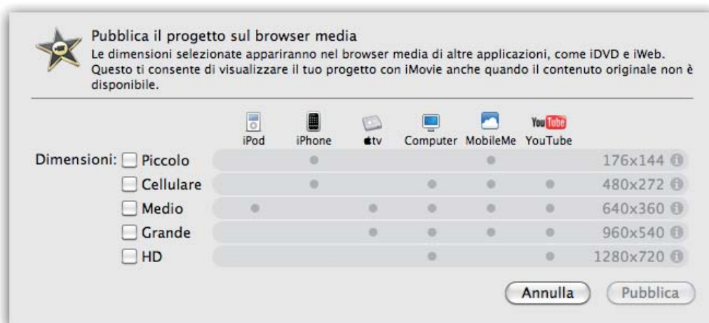
Figura 3: la finestra di dialogo per l'esportazione per il browser media

Esiste anche la funzione di esportazione per browser media . A cosa serve? Tutte le applicazioni di iLife o di iWork hanno un browser media utilizzabile per esplorare il contenuto multimediale del computer. Esportando un filmato per il browser media, sarà possibile usarlo, per esempio, in applicazioni come iWeb . Nella figura 3 , potete osservare la finestra per l'esportazione in questo formato che come potete osservare è simile a quella per l'esportazione da iTunes.