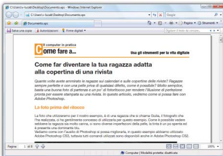
Figura 3: un documento XPS aperto in Internet Explorer 7

I documenti XPS sono al momento visibili solo da Windows Vista , Windows XP e Windows Server 2003 , attraverso Internet Explorer 7 , come per realizzarli, anche per leggerli su Windows XP e Windows Server 2003, è necessario che siano installati Microsoft .NET Framework 3.0 e Microsoft XPS Essentials Pack visti in precedenza.