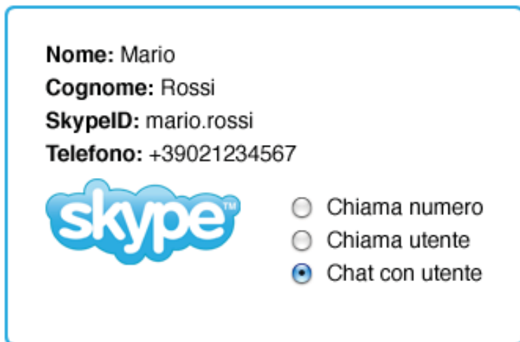
Figura 1: struttura della scheda utente

Il database FileMaker Pro che useremo come esempio, ha questa semplice struttura: