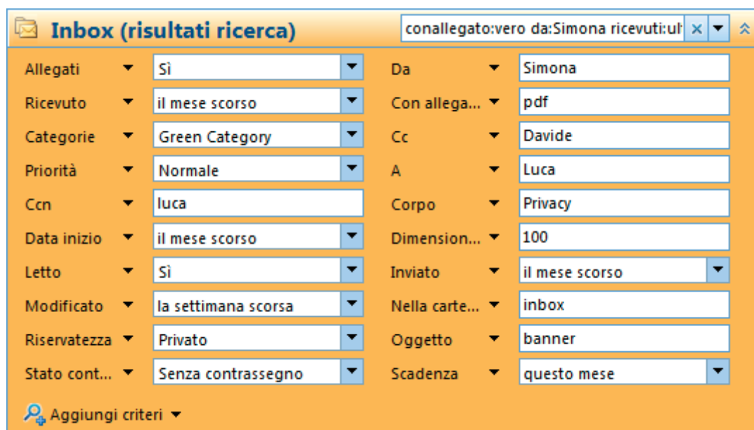
Figura 3: l'utilizzo completo di tutte le opzioni di ricerca

Per impostazione predefinita la ricerca avanzata mostra quattro box che sono configurabili scegliendo le opzioni che si desidera, dal menu accanto a ogni riquadro, tuttavia è possibile aggiungere altri riquadri se necessario selezionandoli dal menu Aggiungi criteri contraddistinto dall'icona di una lente. Come possibile vedere nella figura 3 le opzioni disponibili sono davvero numerose, ed è possibile anche utilizzarle tutte contemporaneamente.