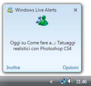
Figura 1: la notizia ricevuta da Windows Live Alerts

Windows Live Messenger è il più diffuso client di messaggistica istantanea al mondo, poter veicolare informazioni tramite questo mezzo è di sicuro vantaggio sia per gli utenti che si abbonano al vostro servizio sia per voi che potete inviare velocemente delle comunicazioni sulle attività svolte sul vostro sito internet. Quando un utente del vostro sito si abbona al vostro Windows Live Alerts , ogni volta che voi ne pubblicherete uno automaticamente verrà ricevuto dall'utente tramite Windows Live Messenger , via posta elettronica o su entrambi, a seconda di quello che ha impostato in fase di abbonamento. Quando si riceve un messaggio, nell'angolo in basso a destra, apparirà una finestrella, vedi figura 1, che mostra quello che avete scritto.