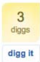
Figura 2: il badge di Digg per segnalare una pagina web

Le pagine che permettono di segnalare un articolo contengono solitamente un badge giallo con un contatore e un collegamento denominato digg it , potete vederlo in figura 2 .