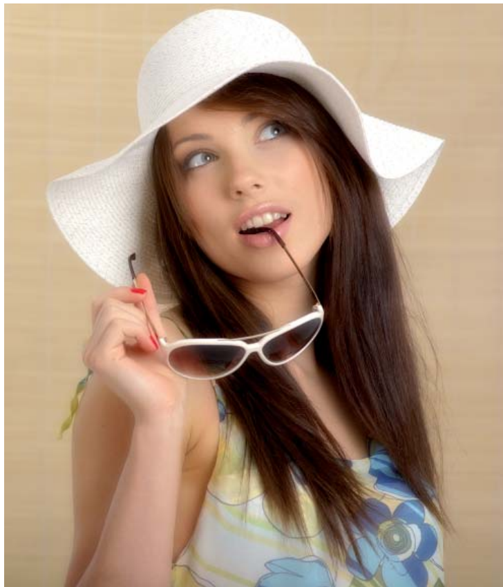
Figura 3: il risultato finale

Se non avessimo creato il negativo del filtro Accentua passaggio... , avremmo ottenuto esattamente l'effetto contrario, ossia un maggior contrasto dei contorni delle immagini. Memorizzate questa possibilità, potrebbe tornarvi utile in altri tipi di elaborazione.