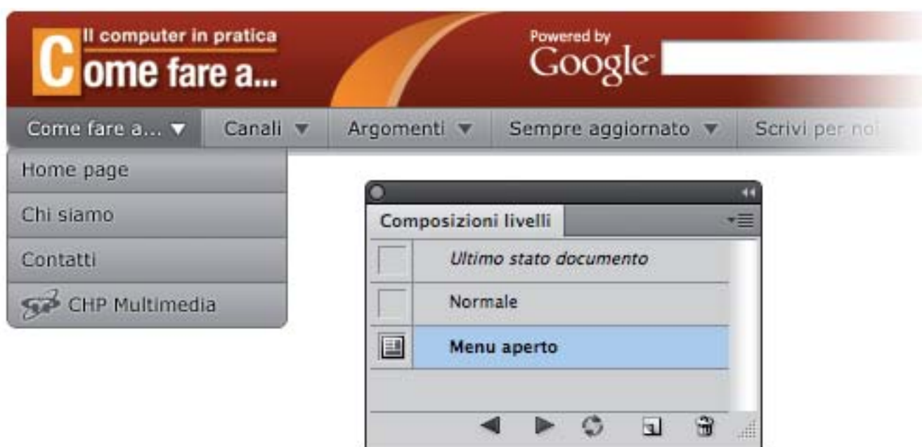
Figura 4: abbiamo creato una nuova composizione livelli con il menu aperto

Per selezionare una composizione ricordatevi sempre di fare clic sul quadratino evidenziato in figura 3 e non sul nome della composizione.