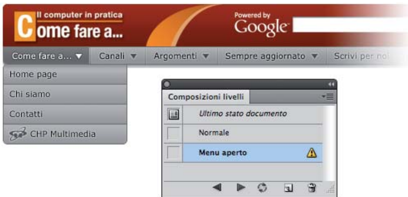
Figura 6: eliminando un livello da una composizione viene evidenziata un'icona di avviso

Cosa succede se invece di aggiungere eliminiamo un livello che era presente in una delle composizioni? Molto semplice, come mostrato in figura 6, apparirà un punto esclamativo accanto alla composizione interessata, anche in questo caso, sarà sufficiente fare clic sull'icona corrispondente alla funzione Aggiorna composizione livelli , per rimettere a posto la situazione.