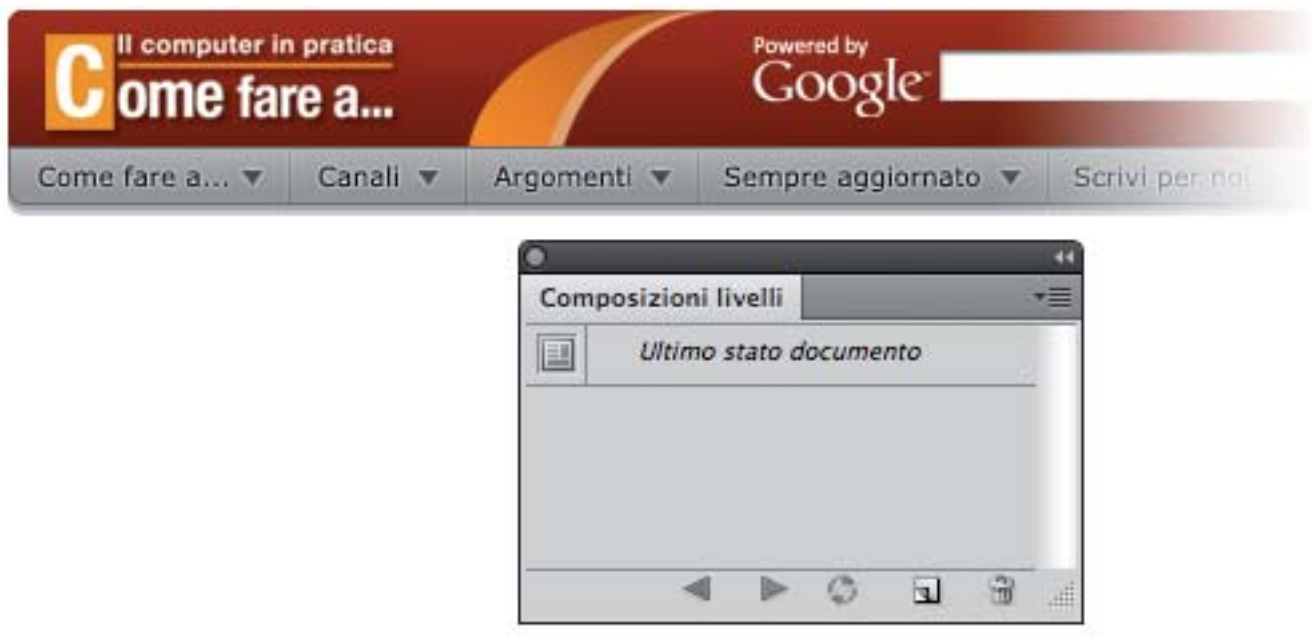
Figura 1: la palette Composizione livelli, al momento non è stato registrato nessuno stato

Per prima cosa, apriamo la palette Composizione livelli , disponibile nel menu Finestra , la potete vedere nella figura 1 , ovviamente in questo momento è vuota perché non è stata registrata nessuna composizione.