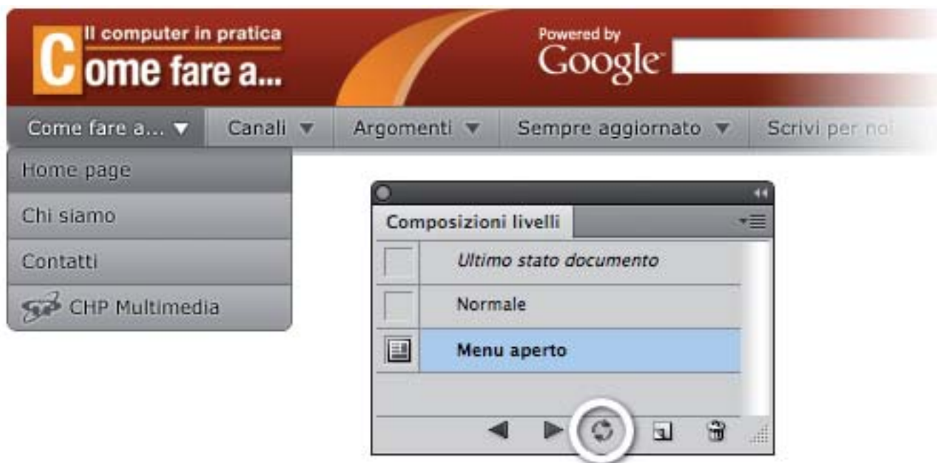
Figura 5: aggiornando la composizione dei livelli abbiamo aggiunto una voce selezionata nella tendina

Cosa succede se invece di aggiungere eliminiamo un livello che era presente in una delle composizioni? Molto semplice, come mostrato in figura 6, apparirà un punto esclamativo accanto alla composizione interessata, anche in questo caso, sarà sufficiente fare clic sull'icona corrispondente alla funzione Aggiorna composizione livelli , per rimettere a posto la situazione.