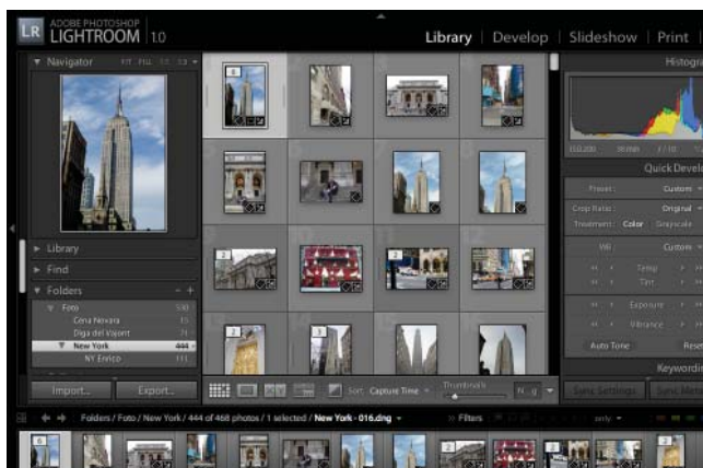
Figura 2: la finestra Library di Lightroom.

Questa è la prima area di lavoro del programma che, come suggerisce il nome, serve a gestire le fotografie.