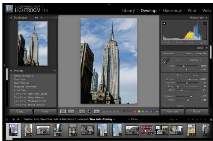
Figura 3: La finestra Develop , per la correzione delle foto.

Una volta catalogate le nostre foto, e fatte le prime correzioni, si passa all'area Develop dove si lavora nel dettaglio su ogni singola foto o su gruppi di foto simili, con tutti gli strumenti del programma e in parte già utilizzati nella finestra Library . Come vedremo gli strumenti messi a disposizione sono molto sofisticati, in particolare se le foto sono in formato RAW ma anche se sono dei semplici JPEG . La cosa bella è che qualunque correzione voi facciate, è sempre possibile tornare indietro, questo perché le modifiche fatte vengono registrate nei metadati delle foto e applicate dal programma per mostrarvele.