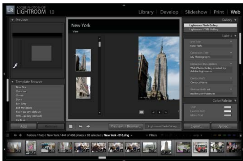
Figura 6: La finestra Web, per le presentazioni su Internet.

Se gli Slideshow non vi convincono per far vedere i vostri lavori a distanza, è possibile utilizzare le gallerie web , che sono molto belle e ben costruite. Si possono fare sia statiche che animate con qualche transizione utilizzando la tecnologia Flash.