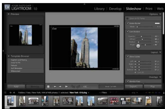
Figura 4: La finestra Slideshow per la presentazione delle foto.

Come facilmente intuibile dal nome in quest'area del programma si possono creare delle presentazioni da utilizzare per presentare velocemente e professionalmente ai nostri clienti il lavoro svolto. Le presentazioni sono molto veloci da realizzare, ma presentano alcune limitazioni: si possono vedere solo da Lightroom o in alternativa esportarle come PDF, questo limita un po' la possibilità di spedire le presentazioni ma rende più facile la vita se ci rechiamo dai nostri clienti con un portatile.